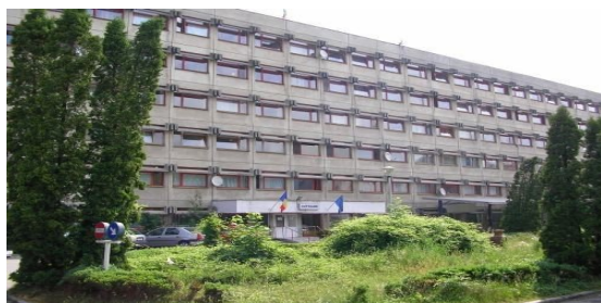
Intrarea principală Institutul de Urgență pentru Boli Cardiovasculare „Prof. Dr. C. C. Iliescu” București