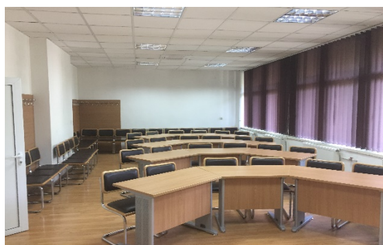
Sala de examen: BIBLIOTECA